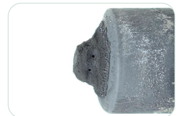
Dieselbe Einspritzdüse nach 5.000 km mit Shell FuelSave Diesel.