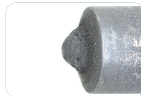
Verschmutzte Einspritzdüse in einem britischen LKW nach Verwendung von Standard-Diesel.

Die exklusive Formel verfügt über zwei Reinigungskomponenten, die helfen, die Einspritzdüsen von Ablagerungen zu reinigen und freizuhalten.